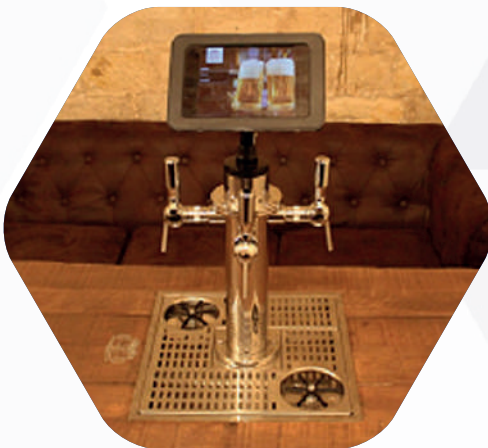
TABLE À BIÈRE