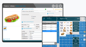
Menu intuitif spécifique aux commerces alimentaires

Innoshop Food est doté des fonctionnalités classiques d'un système de gestion, mais également de fonctions spécifiques aux commerces alimentaires : grâce à son interface moderne et ses fonctionnalités sur-mesure, il vous accompagne dans la gestion quotidienne de votre point de vente.