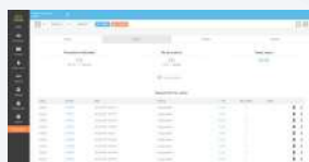
Détail des ventes