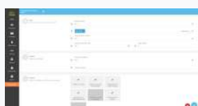
Gestion des stocks