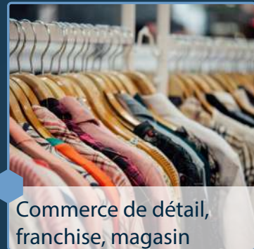
Commerce de détail, franchise, magasin