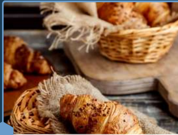
Boulangerie, pâtisserie, point chaud