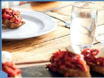
Café, hôtel, restaurant & brasserie