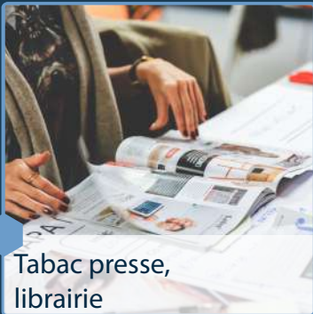
Tabac presse, librairie