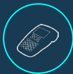
TERMINAUX DE PAIEMENT ÉLECTRONIQUES