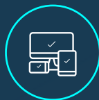
SITES INTERNET E-COMMERCE