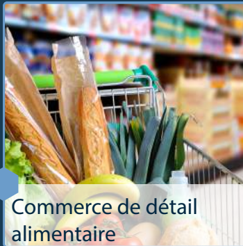
Commerce de détail alimentaire