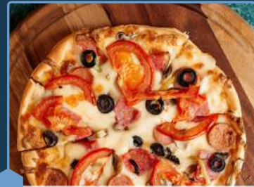
Restauration rapide, snacking, food truck, vae