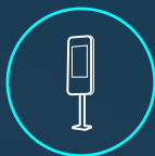
BORNE DE COMMANDES